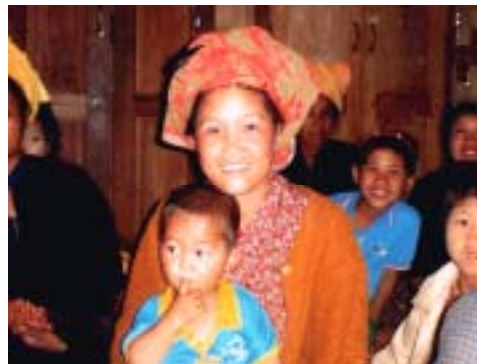
2004年：母子との2年ぶりの再会。 子どもは元気にすくすく成長していた。

しかし2001年以来、毎年スタディツアーでこの地を訪れ、村人と交流を続け、その間確実に村人との距離は縮まっていった。そして私は、ある母子に目が留まった。見覚えがある顔だった。それは2年前、写真に撮った母子であった。赤ちゃんだった子どもは2歳になり、見違えるほど大きくなっていて、不思議な気持ちだった。