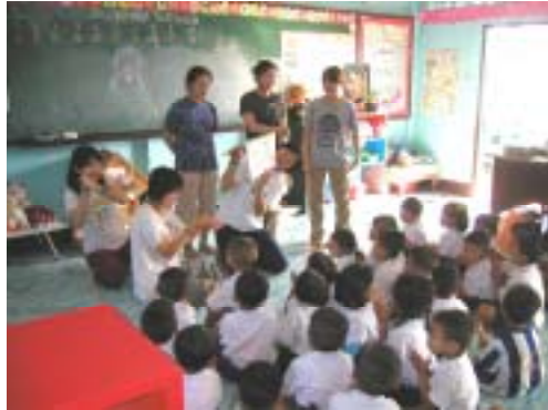
MuuMuu: 幼稚園でドラえものの紙芝居の衛生教育

現在報告書を作成中です。今年は、現地の現状、活動内容、生徒のアンケート結果報告に加え、日本の中学校で取ったアンケート結果と比較するなど昨年以上に充実した報告書にしたいと思います。この報告書がより多くの方にMuu-Muuを知ってもらおうキッカケになれば幸いです。お楽しみに！