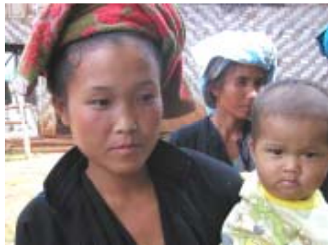
2001年：初めて会ったポンタン村の母子

そこには、人と人が支え合い、共に働き、共に笑い、その大人たちの周りを遊び回る子ども達の姿がある。