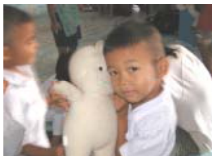
人形を離さない男の子(WSK孤児院)

不思議なことに、この隔離策により、年長者の生活にも秩序ができ、年長者の寮舎も昨年より清潔になり、落ち着いてきたように見受けられました。