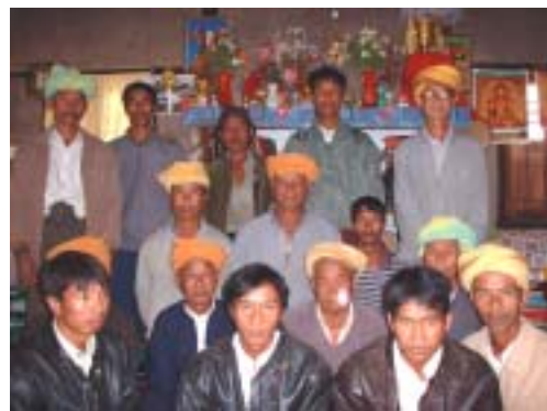
ティハムスエ村の建設委員会メンバー。 子ども達の明るい未来のために頑張るお父さん達。