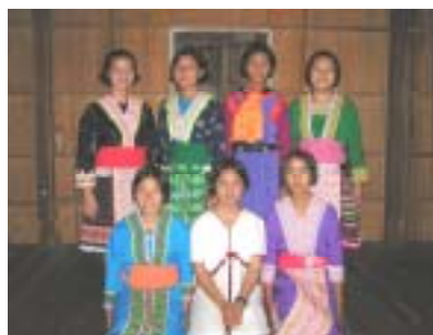
自分たちで作った民族衣装を着る メーター校女子生徒たち

“Welcome！メーターの子ども達” 子ども達の滞在費支援に ご協力ください！