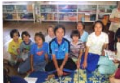
女子寮の生徒たち: 年長者が母親代わり

現物の支援: 新品のランニングタイプのシャツ、パンツ 支援金のご寄金 物価の安いタイ国で購入して直接届けます 下着メーカーなどのご紹介: メーカー・販売店に勤めている お知り合いがいらっしゃいましたらご紹介ください。 連絡や説明は TPAK が責任を持っています。