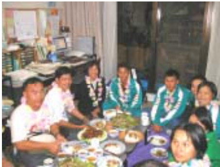
メーター学校の9人。クラブハウスにて歓迎会

メーター村～チェンマイ～バンコク～成田～横浜という長い移動距離を丸一日かけて来浜、成田空港到着時は疲れと期待、緊張の面持ちでした。