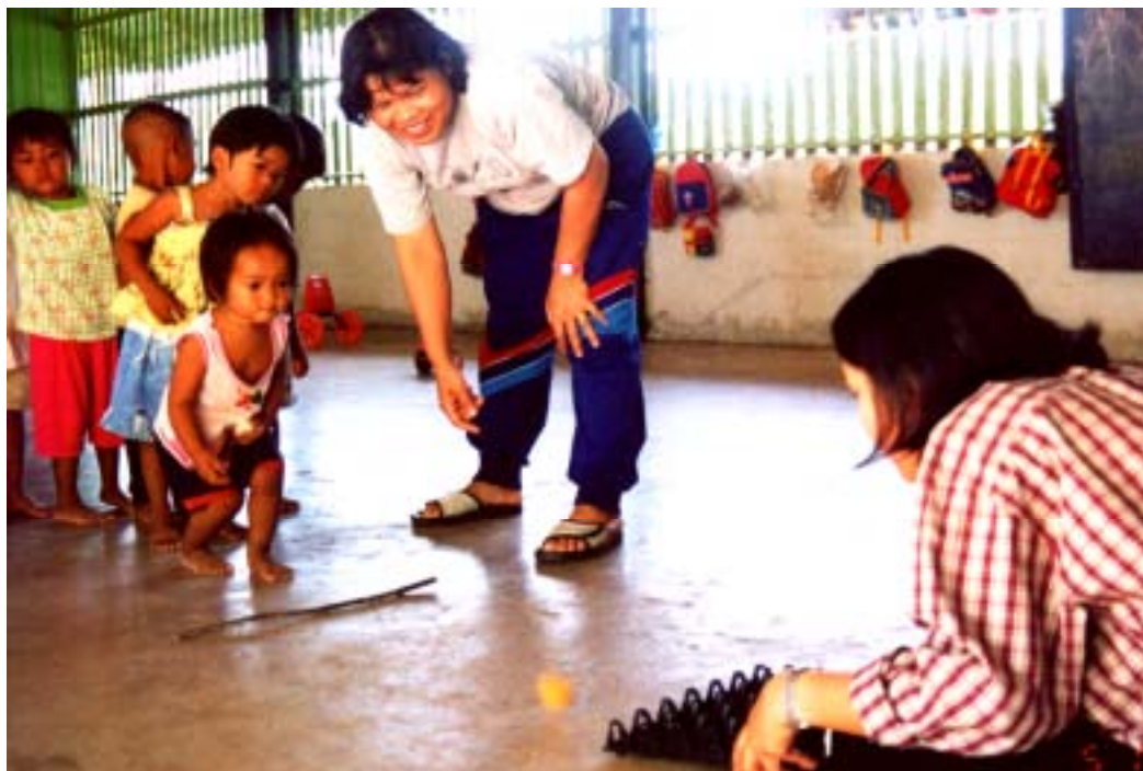
移動寺子屋でピンポン球のたまご入れゲームに熱中する子ども達 (タイ国コンケン県ノンナカム郡ファナモー村)