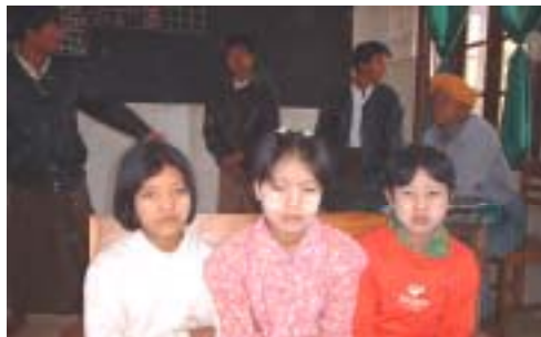
入寮予定の生徒：実家は学校から徒歩で片道3時間

2004年3月から、国際開発救援財団の助成により始まったミャンマー国ティハムス工村の「学校寮及び多目的ホール建設プロジェクト」。現在、村人の積極的な参加により学校寮の建設が着々と進んでいます。完成後は現在教員宅で暮らしている3人の生徒が入寮する予定です。その後も「村に学校がなく教育の機会のない子ども達をこの学校寮で受け入れていきたい」と村人は言います。また、子ども達の就学環境を充実させるため、多目的ホールの建設計画も進めています。