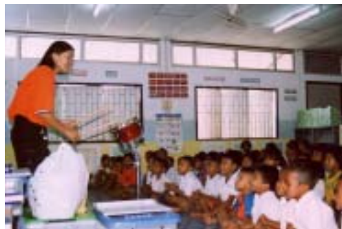
音楽や歌、ゲームを通して楽しく学ぶ