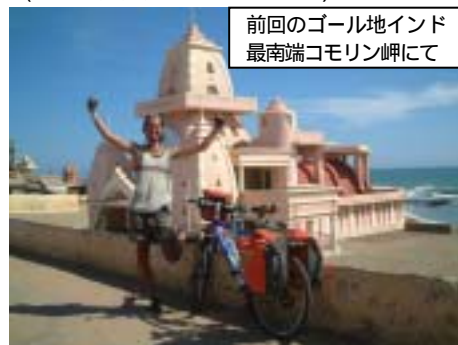
前回のゴール地インド 最南端コモリン岬にて

そして今回、スタート地点に向うためにまた列車に乗らないとならない。デリーまで1泊2日の移動。今回は何も盗られてたまるものか。ある意味、チベットでのサイクリングでは、ここが1番の難関だろう。(2004,6,6,カルカッタにて)